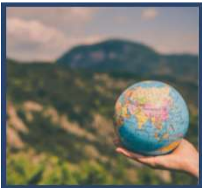
Pourquoi 30 %?

Consultez ces ressources de notre partenaire collaborateur, Campaign for Nature, qui fournissent un contexte scientifique et expliquent les nombreux avantages environnementaux et économiques du mouvement mondial 30x30.