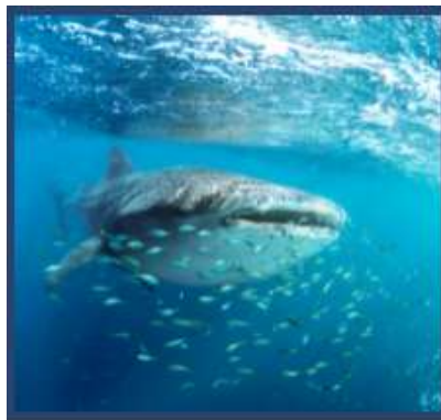
L'importance de la biodiversité