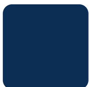
Deep Sea Blue #0D2E54

Utilisez cette palette de couleurs dans vos messages sociaux et vos graphiques.