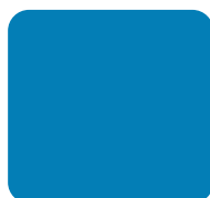
Pelagic Blue #037EB6