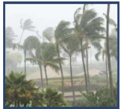
Coût et bénéfices de 30x30