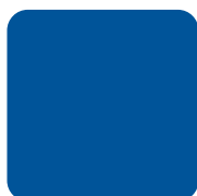
Inlet Blue #005499