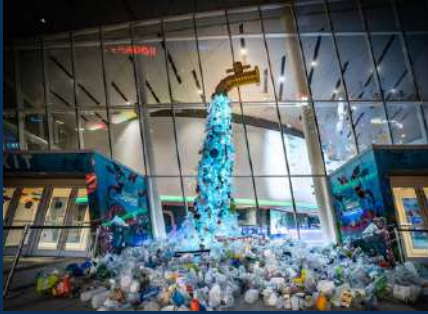
Ripley's Aquarium, Toronto ON