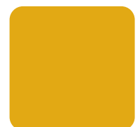
Diz Yellow #E2A914