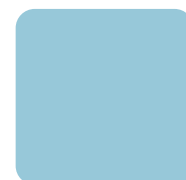
Sky Blue #97C8D9